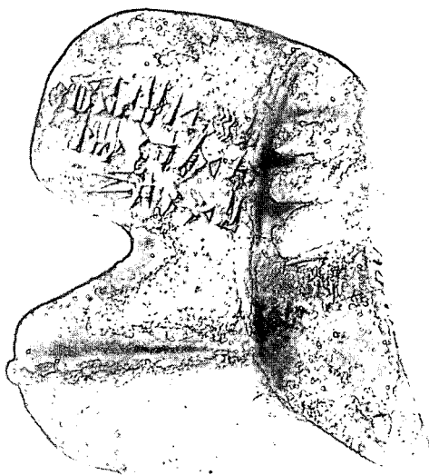
Maqueta de fígado de animal, de argila, com texto divinatório referente à destruição de pequenas cidades. Palácio de Mari (Síria), 6,6 x 5,9 cm, séc. XIX a.C. Museu do Louvre, Ao 19837.