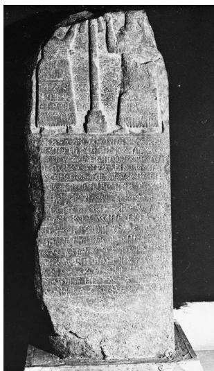
FIGURA 1 – Monumento de Antakya.