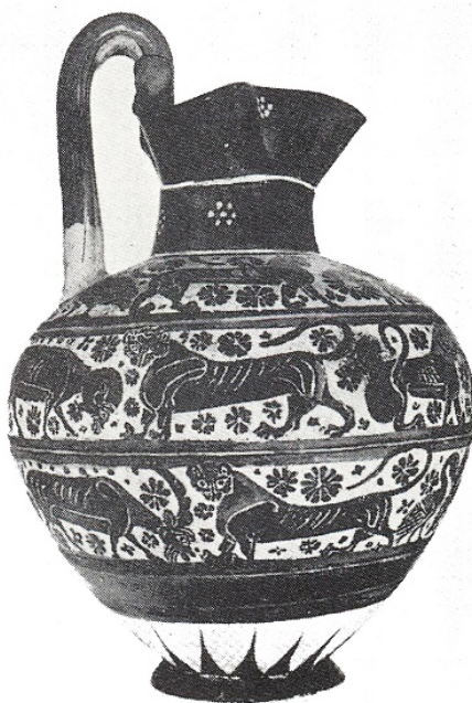
FIGURA 2 – Enócoa coríntia orientalizante influenciada pelo “ Wild Goat Style ” (625 a.C.).

(Rodes, Quios, Clazômenas e Náucratis) no decurso do século VII a.C. até os primeiros anos do século VI a.C. (Martine, 1994, p. 24). Na Fig. 2, podemos observar uma enócoa trilobada de Corinto, em que a influência orientalizante se mistura com o “ Wild Goat Style ”.