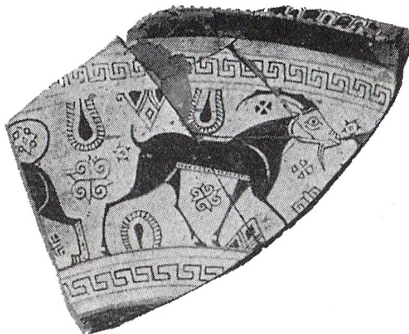
FIGURA 4 - Fragmento de prato de Quios, “ Wild Goat Style IP ” (615 a.C.)

de Empório (Quios), de Tocra (na Líbia) e de alguns contextos de túmulos de Esmirna (Cook, 1992, p. 141). Em Quios, o estilo orientalizante foi adotado concomitantemente ao estilo “cabra selvagem”, no século VII a.C., na transição do Middle Goat Style I e Middle Goat Style II (Cook; Dupont, 2008, p. 46; cf. Fig. 4).