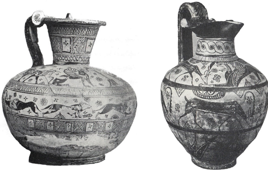
FIGURA 3 – À esquerda: Enócoa (630 a.C.) do Middle Wild Goat Style I . À direita: Enócoa (625 a.C.) Middle Wild Goat Style II

fase; as formas ainda eram do subgeométrico e a decoração foi marcada pela representação de cães, leões, esfinges e grifos (Cook; Dupont, 2008, p. 32). Os primeiros exemplares do estilo começam a aparecer, de maneira mais consolidada, a partir do chamado Middle Wild Goat Style I (640-630 a.C.), de acordo com Cook e Dupont (1998). As características decorativas são marcadas pelos florais representando flores de lótus, palmetas, rosetas e detalhes mais apurados da fauna. Com a crescente adoção do estilo orientalizante na Grécia Oriental, o chamado Middle Wild Goat Style II (625-615 a.C.), cf. Fig. 3., apresenta posteriormente uma decoração e formas mais variadas, marcadas pelas aves e por criaturas monstruosas híbridas para o repertório de imagens (Cook; Dupont, 2008, p. 40).