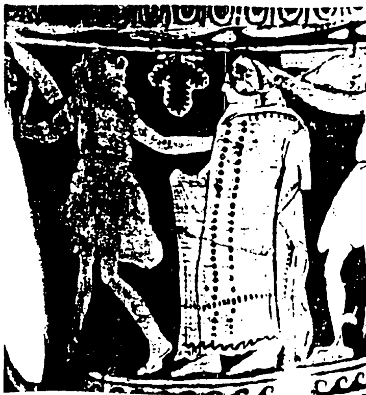
Figura 1: Morta iniciada sendo levada por dois demônios. Cratera etrusca em forma de cálice com figuras vermelhas do 3º quartel do século IV a.C. do Museu Cívico de Trieste, 2125 (in Lexicon Iconographicum Mythologiae Classicae , vol. III2, p. 232, nº 85).

ABSTRACT: The Etruscan archaeological documentation reveals the permanence of the cult of Dionysus in some etruscan cities, as well as the official acceptance od such cults in the domestic sphere. Particularly in the IV century b.C. we find a group of vases which associate dionysiac and funerary elements, emphasizing the deceased priviledged condition as an initiate. Many other images in etruscan 4th century vases stress the roles of dionysiac religion and matrimony in afterlife, for by their means the reproduction and perpetuation of the deceased family history, and consequently, that of yhe city, are warranted. KEY WORDS: Etruria, dionysism, image, cults, identity, death, matrimony.