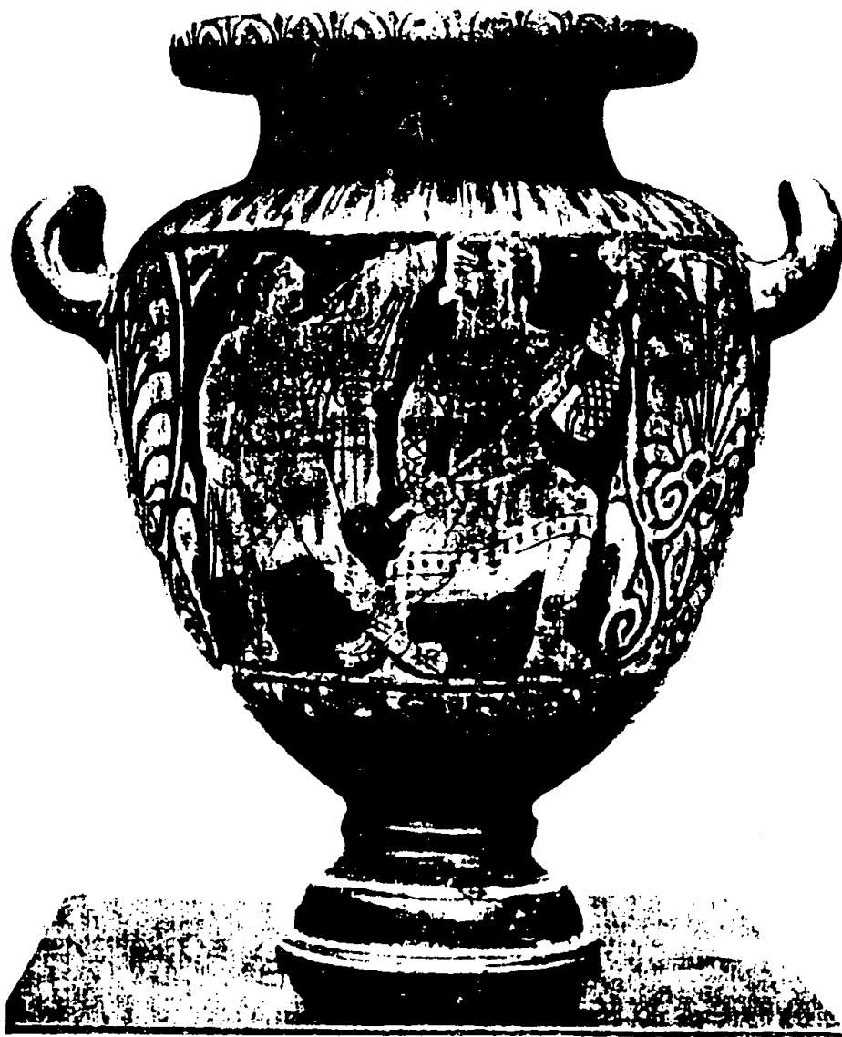
Figura 2: Morta iniciada abrindo o manto para o demônio Charum. Stamnos etrusco com figuras vermelhas da metade do século IV a.C. do Museu Cívico de Trieste, 7630 (in DE RUYT, F. Archeologia Classica XV: 97-101, 1985).