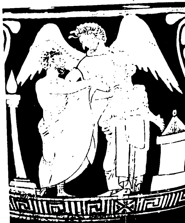
Figura 3: Despedida de Alceste e Admeto. Skyphos etrusco com figuras vermelhas de 330 a.C. do Museum of Fine Arts de Boston, 97 372 (in BEAZLEY, J. D. Etruscan Vase Painting, London, 1947, pr. 37).