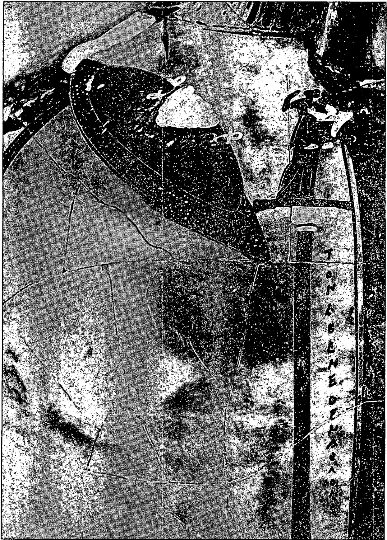
Fig. 1) Ânfora panatenaica. Atenas, Museu Nacional 20044.