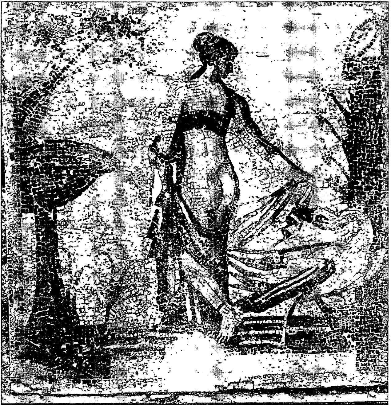
Fig. 7) Mosaico : Palaepaphos (Chipre), Museu.