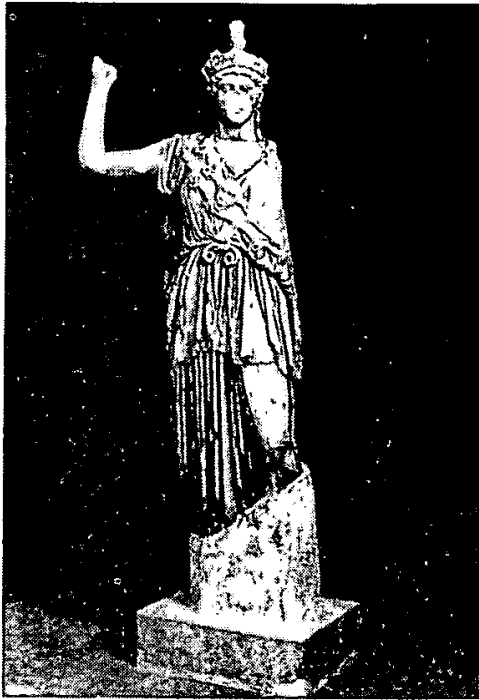
Fig. 3) Estátua : Palmira, Museu : A 138-75.