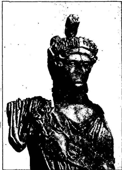
Fig. 4) Idem, pomenor.