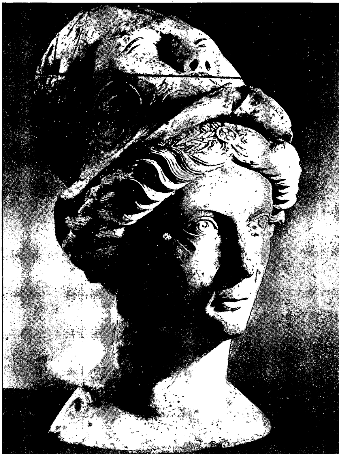
Fig. 5) Cabeça de estátua. Avenches (Suíça), Museu Romano.