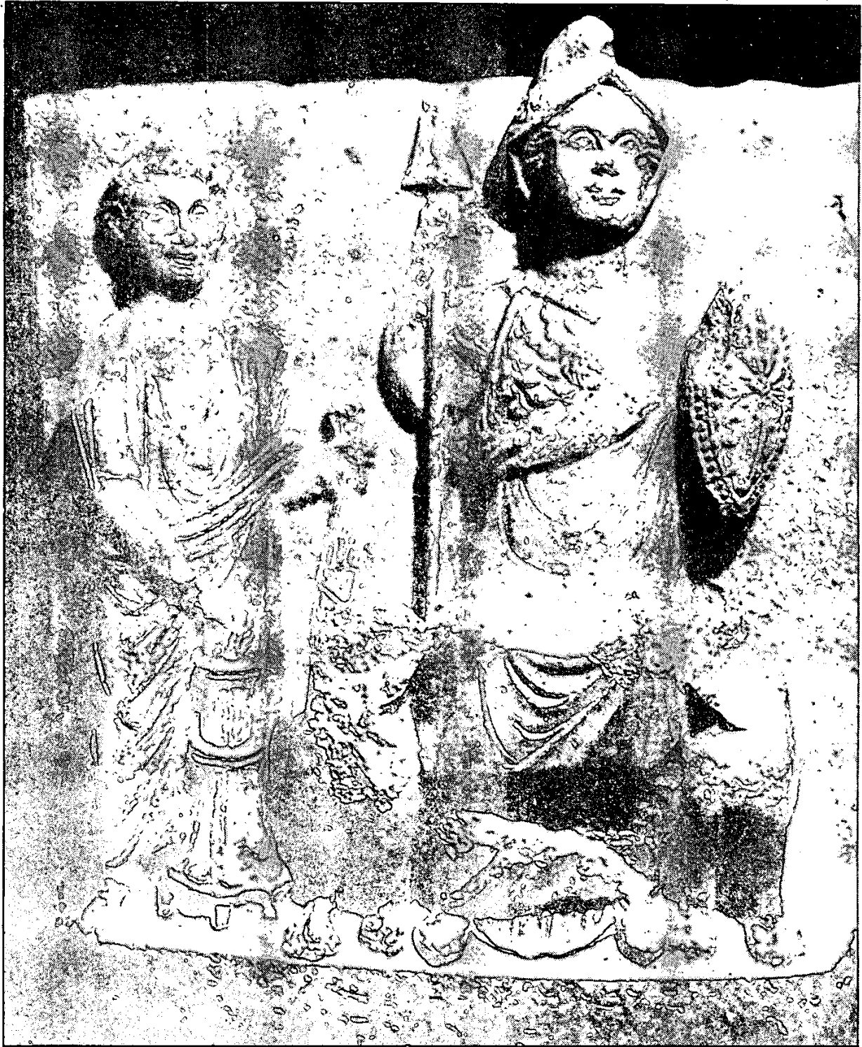
Fig. 2) Relevo : Damasco, Museu Nacional 2351 (4934).